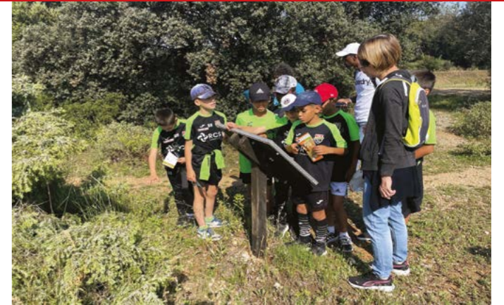
SJE s'engage dans l'éducation à l'environnement des jeunes védasiens. Cette expérience peut être poursuivie à l'automne sur le thème de la Mosson.

A la demande d'un entraîneur de l'école de foot, l'association est partie à la découverte de la garrigue avec les jeunes. Le but était de les familiariser à ce milieu. Mercredi 24 mai 2023, nous avons exploré le parcours nature grâce aux panneaux didactiques installés initialement par SJE. Nous avons observé les arbres et plantes méditerranéennes typiques de ce milieu comme le ciste, le cade, le paliure, le lentisque, le genêt d'Espagne, le chêne. Quelques fleurs ont égayé la sortie ainsi que quelques bestioles bien affairées. Nous avons terminé par une lecture de paysage nous permettant de prendre des repères et de situer les villages alentour et le pic Saint Loup.